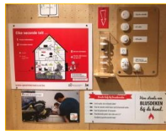
Pop-upstore HVZ FLuvia