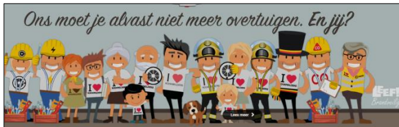
leefbrandveilig.be HVZ Vlaams-Brabant Oost